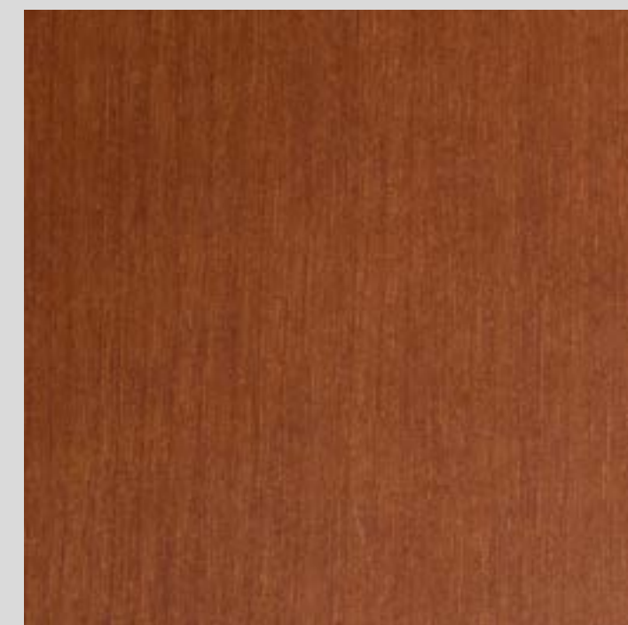
tinto Noce medio