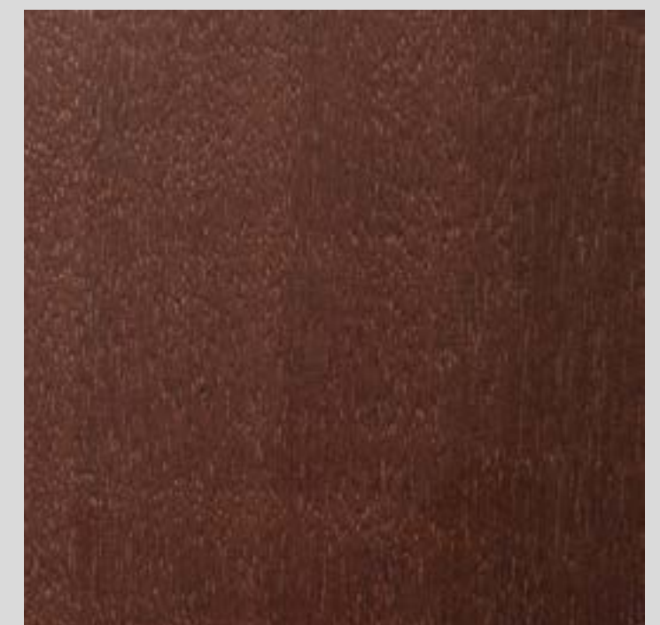
tinto Noce scuro